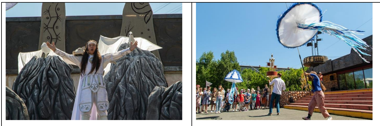
«Чир Чайаан» ( https://достижения.рф/achievements/region/1203 )

Мир русского театра уникален и разнообразен. На фотографиях изображены выступления актёров на Международном фестивале театров кукол «Чир Чайаан» – важнейшем театральном событии Республики Хакасии. Выразительно прочитайте текст о фестивале «Чир Чайаан» вслух.