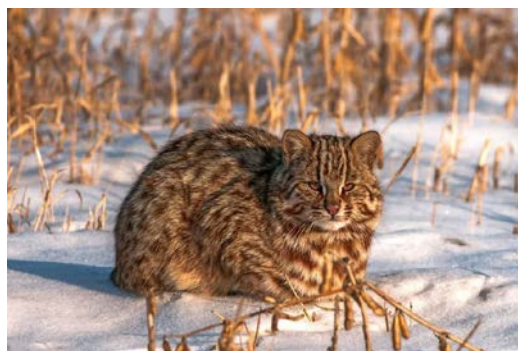
Амурский лесной кот