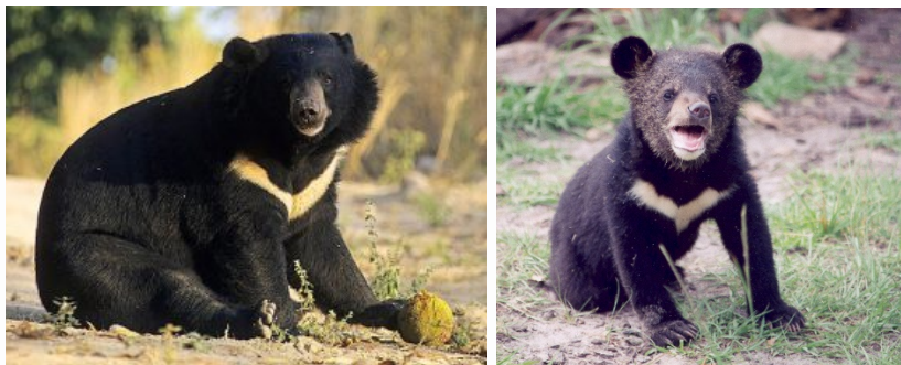
Уссурийский медведь и медвежонок

В заповеднике обитают гималайские медведи. Большеухие, с белой отметиной на груди, эти медведи умные и сообразительные.