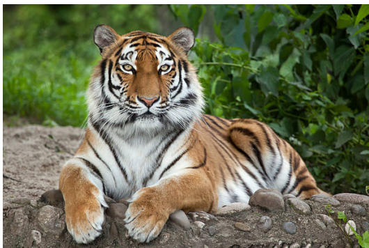
Амурский тигр (которого часто называют уссурийским) – царь этого заповедника.

Представьте: если бы не работа людей в заповедниках, мы бы больше никогда не увидели амурского тигра и других прекрасных животных.