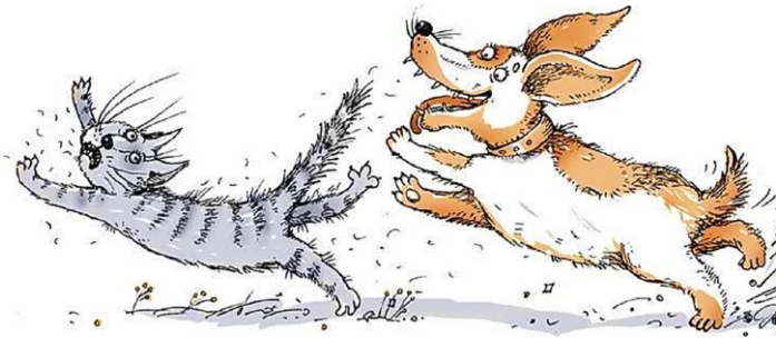
Рис. Щенок бежит за котёнком

Задание. Обсудите, что значит выражение «задать стрекача».